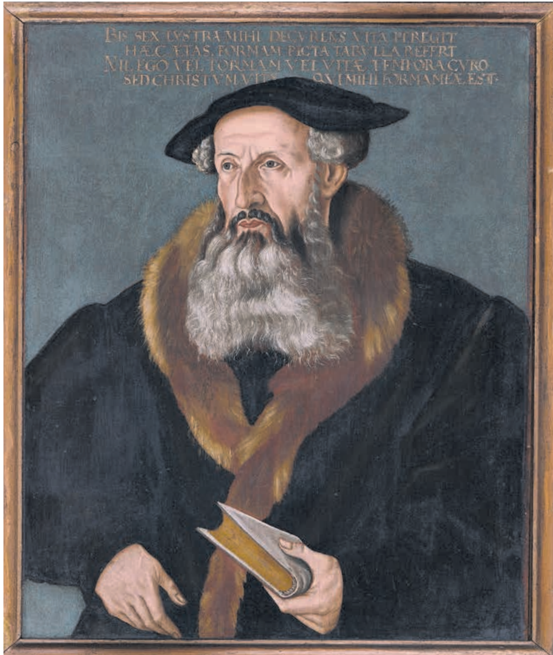
Der Reformator Heinrich Bullinger (1504-1575) hinterliess einen der umfangreichsten Briefwechsel des 16. Jahrhunderts. Anonymes Porträt, um 1564.

Der Brief vom 1. März 1554 ist einer von 12 000 Briefen im Briefwechsel von